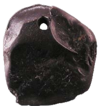
Afb. 3. Een hanger van git. Bewijs voor lange afstand relaties met andere culturen.

dan tijdens het mobiele leven van de jager-verzamelaar. Voor het grootbrengen van hun kinderen lijken vrouwen dus meer voordeel te halen uit een boerenbestaan dan mannen. Dit kan al dan niet bewust gevolgen hebben gehad voor hun partnerkeuze.