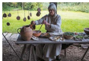
Koken in Dorestad

levendige sfeer op de locatie en ook de bijbehorende tuin ten goede.