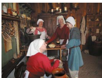
Chirurgijngilde in middeleeuwen

Het gilde wordt gevormd door een groep enthousiaste vrijwilligers van de Vrienden van Archeon die het leuk vinden om in museumpark Archeon in tijdgeenkleiding te vlechten voor het park. Iedereen die kan vlechten maar ook iedereen die het ambacht graag wil leren is welkom in het gilde. De leden van het gilde helpen elkaar bij het vlechten, waarbij gezelligheid voorop staat. Vlechtmateriaal wordt vertrekt door Archeon, waarbij alles wat gevlochten wordt bestemd is voor het park. Het vlechten vindt voornamelijk plaats in het mandenvlechttershuisje in de Damstraete van het middeleeuwse stadje Gravendam. Het is natuurlijk ook mogelijk op de verschillende locaties in de prehistorie te gaan vlechten.