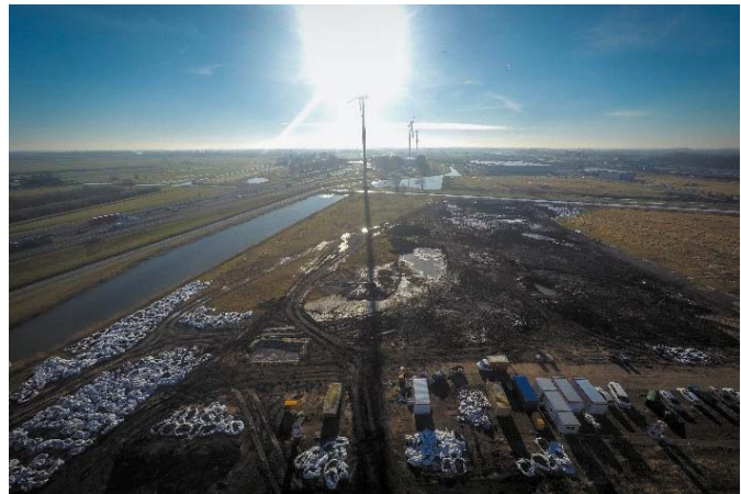
Afb. 1. Nieuwegein 2017: Een opgraving door de archeologie bedrijven BAAC en RAAP.

bekend dat zij gedurende hun bestaan steeds meer gebruik gingen maken van akkerbouw en veeteelt zonder de jacht volledig uit het oog te verliezen. Hoewel de overgang van jagen-verzamelen naar een boerenleven vanuit een westers oogpunt misschien een logische stap lijkt, is dat geenszins het geval. Met de overgang zijn een flink aantal nadelen verbonden. Zo zullen jager-verzamelaars weinig tot geen kennis hebben gehad van het boerenleven, wat zekere risico's met zich meebrengt. De eentonige en harde manier van leven veroorzaakte gezondheidsrisico's. Zo is vastgesteld dat de vroege boeren een mindere levensverwachting hadden dan jager-verzamelaars en een hogere kindersterfte van kinderen onder de 5 jaar kenden. Bovendien verhoogde het boerenbestaan de kans op gewapende conflicten; waar "bezit" is, kan het worden afgenomen. Daarnaast ontbrak bij de Swifterband-mensen de noodzaak om boer te worden, aangezien ze meer dan genoeg voedsel bij elkaar konden jagen en verzamelen in de natte moerasgebieden waar ze voornamelijk lijken te hebben geleefd. De overgang ging altijd zeer geleidelijk, in het ene gebied duurde het langer dan in een andere, waarbij steeds kleine elementen werden overgenomen. Door middel van partnerkeuze hebben vrouwen daar bewust of onbewust wellicht een beslissende rol in gespeeld. Niet alleen bij de Swifterbandcultuur, maar in het algemeen.