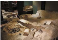
Tempelresten in de kelder van Hotel Derlon

Voorts naar Aquae Granni (Aken), het Roerstreekmuseum in Sint-Odiliënberg en de oude Via Belgica en de weg