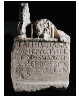
te zien in het Fries Museum

De bekendste stam uit het noorden van Nederland zijn de Frisii of Friezen, de bewoners van Friesland, Groningen en Noord-Holland. We moeten niet te haastig zijn om ze op één hoop te gooien met de moderne Friezen. Nieuwe bewoners in de Laat-Romeinse tijd en Vroege Middeleeuwen kregen de naam Friezen op hun beurt opgespeld.