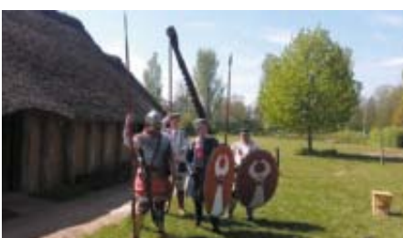
Erve Eme (Zutphen)

Het is een misvatting dat de Romeinen nooit ten noorden van de Rijn zijn geweest. Wel is de bezetting door Romeinse