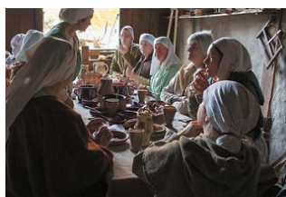
De kookgroep aan de maaltijd

En vervolgens: "Voor alle vrijwilligers geldt dat zij vooral verwachten prettig en volwaardig samen te werken met andere vrijwilligers en vaste medewerkers, mensen te leren kennen, hun netwerk te vergroten en mede daaraan voldoening en plezier te beleven."