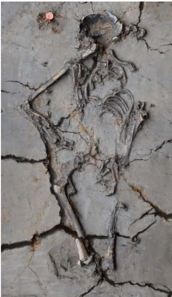
Afb. 2. Het skelet van een vrouw met een baby.

De Swifterbandcultuur leefde tussen 5300 en 3400 voor Christus in delen van Nederland en Duitsland en staat erom