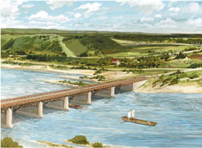
Brug over de Waal bij Nijmegen

Teudurum (Tüddern?), Coriovallum (Heerlen) en de beroemde Sarcofaag van Simpelveld.