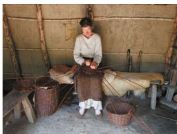
Mandenvlechten in middeleeuwen

Een ander initiatief uit 2017 is het mandenvlechttersgilde . Verschillende vrijwilligers hebben in workshops en andere initiatieven geleerd om een mand te maken. Op de website van de VVvA staat hierover het volgende: