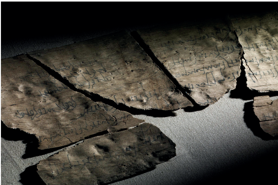
Vindolanda tablet van Claudia Severa, 97-105 n. Chr., Vindolanda Trust, British Museum