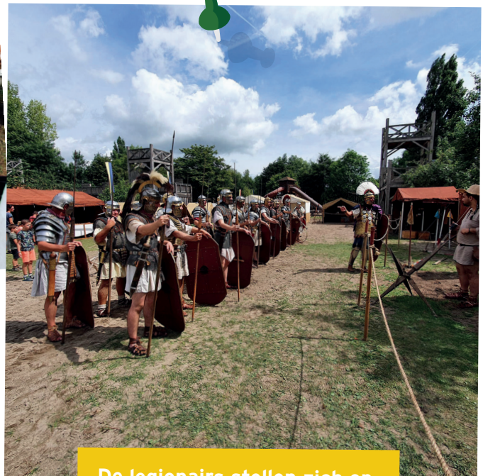
De legionairs stellen zich op