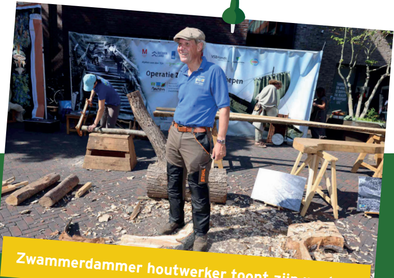
Zwammerdammer houtwerker toont zijn werk