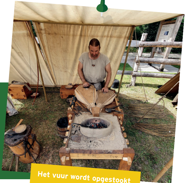
Het vuur wordt opgestookt