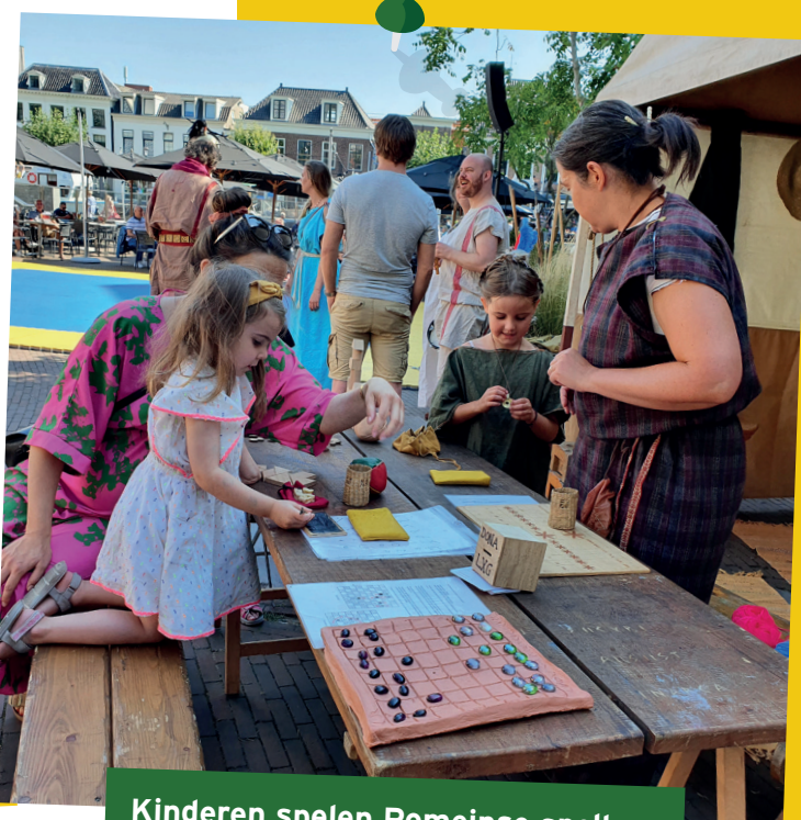
Kinderen spelen Romeinse spellen