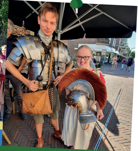
Wow, op de foto met een echte Romein