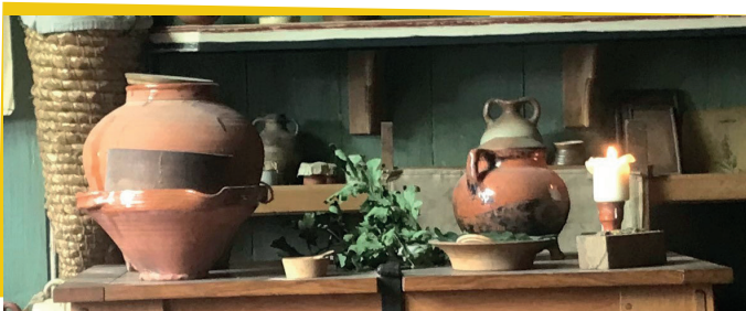
Display van eikel tot as in het chirurgijnshuis van Archeon.

We vertellen onze bezoekers dat afval niet bestaat. Een van de mooie voorbeelden is de eikenboom en alles wat de boom tijdens zijn leven oplevert. Vanaf het moment dat de eikel op de grond valt en ontkiemt begint het al, veel dieren en vooral wilde zwijnen vinden eikels heerlijk.