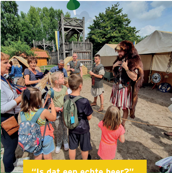
"Is dat een echte beer?"