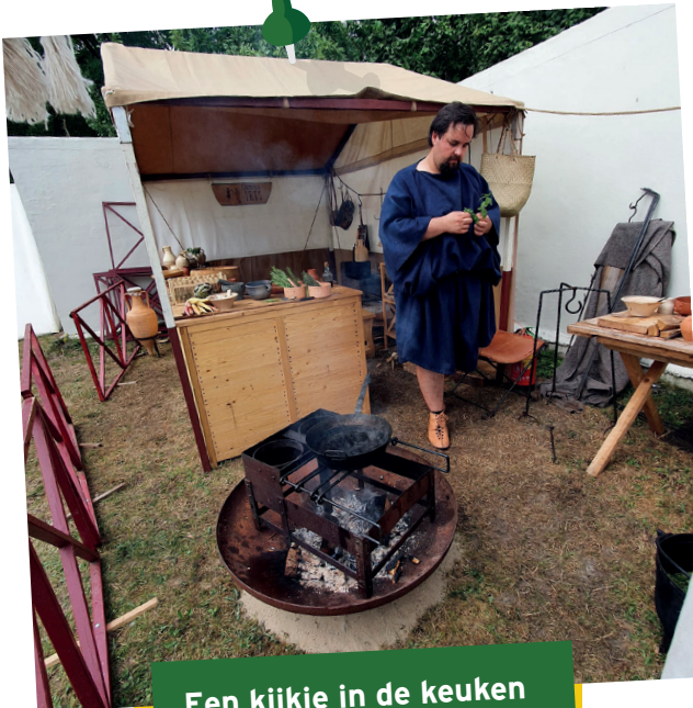
Een kijkje in de keuken