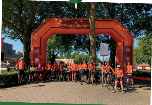
Enthousiaste wielrenners bij de HLC