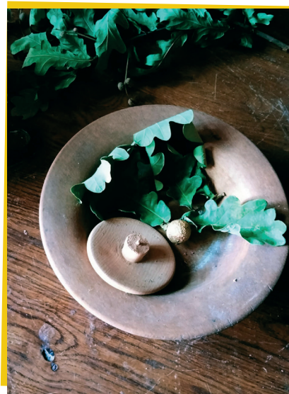
Een eikengal in het chirurgijnshuis

Het blad maakt op deze irritatie een gal aan waardoor er een abnormale groei van het plantenweefsel ontstaat. Ondanks dat het appeltje een scherpe smaak heeft door het aanwezige looizuur, eet de larve die uit het eitje komt zijn buikje rond. Van een galappel kun je op eenvoudige wijze inkt maken. Verpulver de galappel, meng de pulp met water, wijn of een andere vloeistof en je hebt je eigen inkt, de middeleeuwen deden dat al voor. Wellicht werd de tattoo-inkt in de prehistorie op dezelfde manier gemaakt.