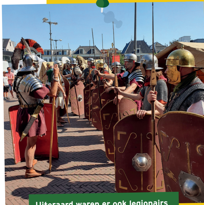
Uiteraard waren er ook legionairs