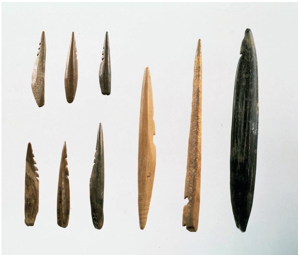
Figuur 1: benen spitsen van de tweede Maasvlakte_RMO Inventarisnr.: h.1982/6.17

afkomstig van onder de Noordzee, van het zogenaamde Doggerland. Uit een mooie studie van Merel Spitshoven (Universiteit Leiden/promovendus archeologie Groningen; https://studenttheses.universiteitleiden.nl/access/item%3A2625538/view ), blijkt dat de pijlpunten allemaal hergebruikt zijn. Het waren eerst langere speerpunten, die nadat ze afgebroken waren, zijn bewerkt tot pijlpunten. Deze werden waarschijnlijk vooral gebruikt om water/moerasvogels