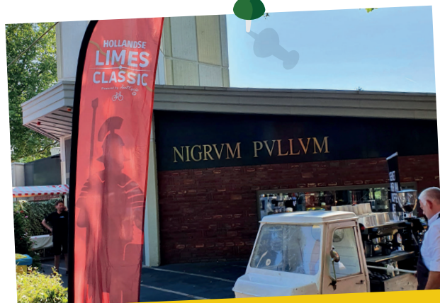
Ipsse de Bruggen was de gastheer van de HLC