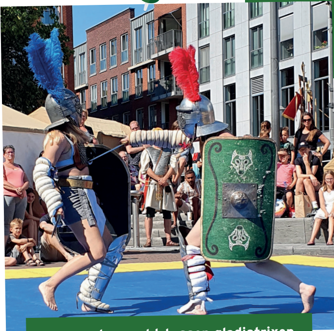
Spannend gevecht tussen gladiatrixen