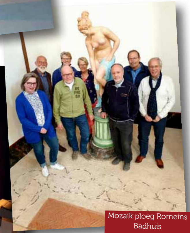
Mozaik ploeg Romeins Badhuis