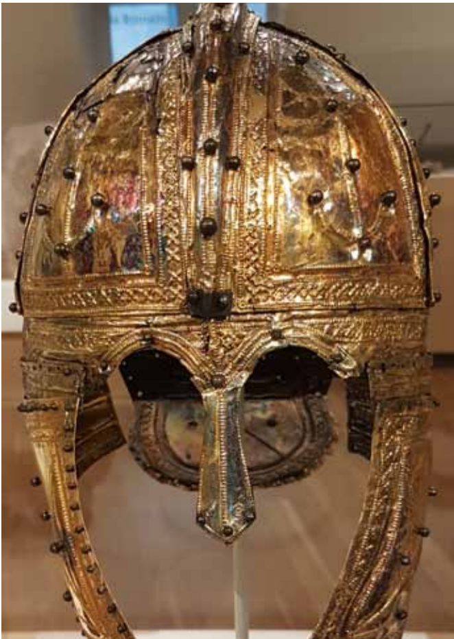
Verguld zilveren ruitershelm ca. 320 N.C.