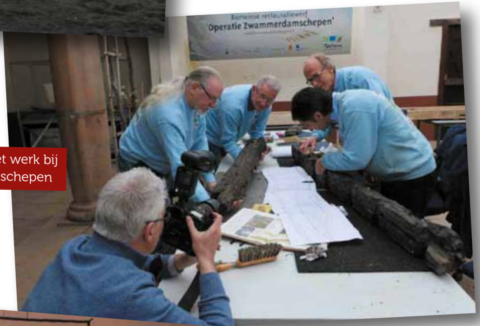
Vrijwilligers aan het werk bij de Zwammerdamschepen