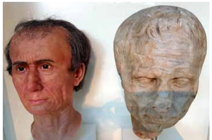
Gezichtsreconstructie van Gaius Julius Caesar