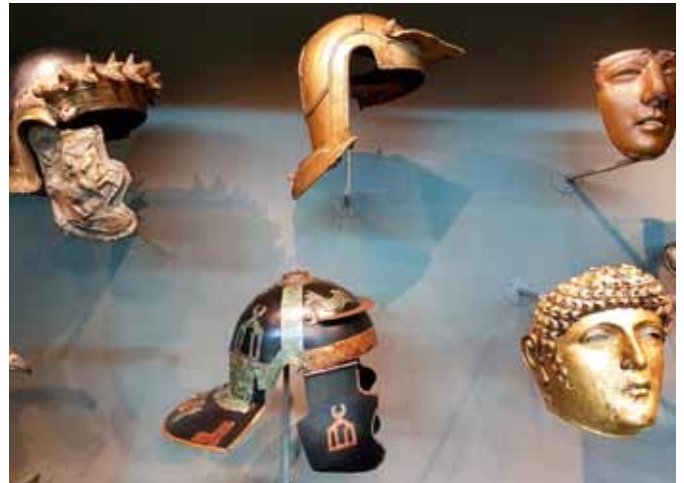
Verschillende Romeinse helmen gevonden in Zuid Holland, Gelderland en Utrecht