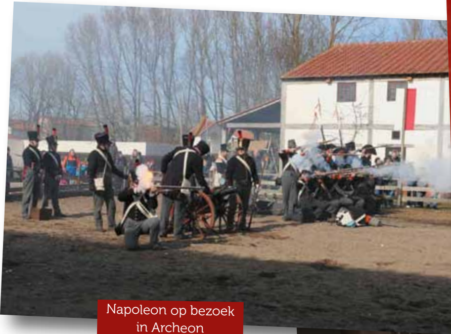
Napoleon op bezoek in Archeon

De vaart zit er goed in en ook dit jaar kon Archeon wederom meer bezoekers verwelkomen en daarnaast steeg het aantal leden en vrijwilligers prettig door bij onze vereniging. Er werden ook vele leuke en interessante evenementen, lezingen, workshops en excursies georganiseerd. Hierbij een foto impressie over 2018.