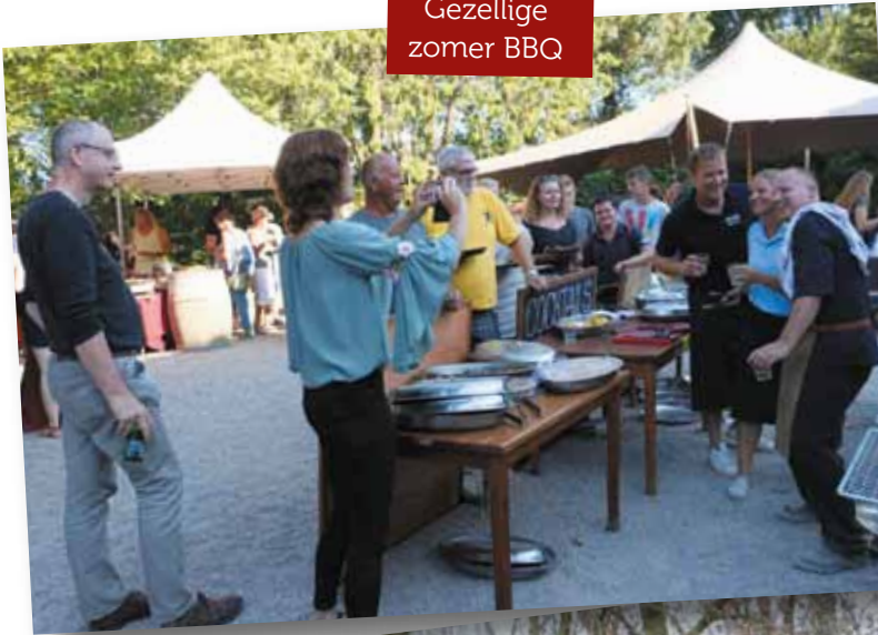
Gezellige zomer BBQ