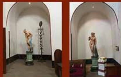
Locatie in het badhuis van de Romeinse mozaïekvloer oplevering voorjaar 2019

Draag ook een steentje bij en maak kans op een workshop mozaïeken. Samen maken we Archeon mooier