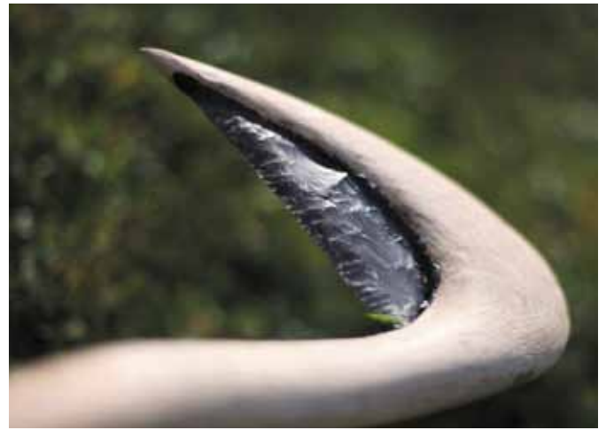
Replica van een neolithische sikkel door Morten Kutschera, foto: Nicole Brody